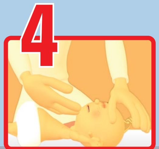
4 Solleva la lingua-mandibola ed esegui lo svuotamento digitale del cavo orale (se corpo estraneo affiorante)