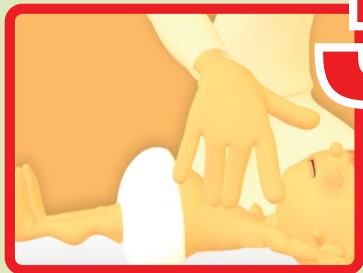
3 Inizia Rianimazione Cardio-Polmonare RCP (30 compressioni toraciche alternate a 2 ventilazioni bocca-bocca/naso in 2 minuti)