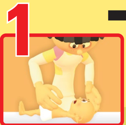
1 Posiziona il paziente su un piano rigido