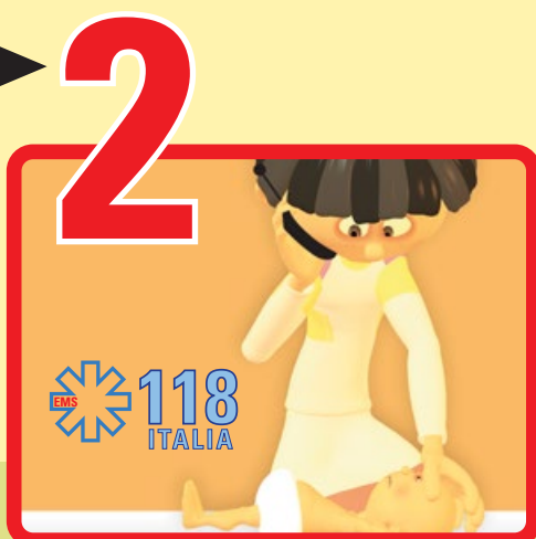
2 Allerta il 118 senza abbandonare il paziente