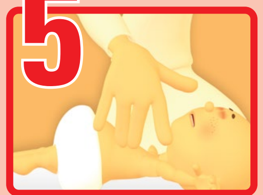
5 Prosegui RCP in attesa del soccorso avanzato

A cura di Stefania Zampogna Contributo alla realizzazione e progettazione: Concetta Procopio Realizzazione e creazione grafica a cura di Umberto Cannistrà