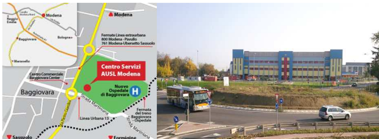
Come arrivare al Centro Servizi AUSL Modena